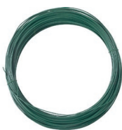
Fil de tension